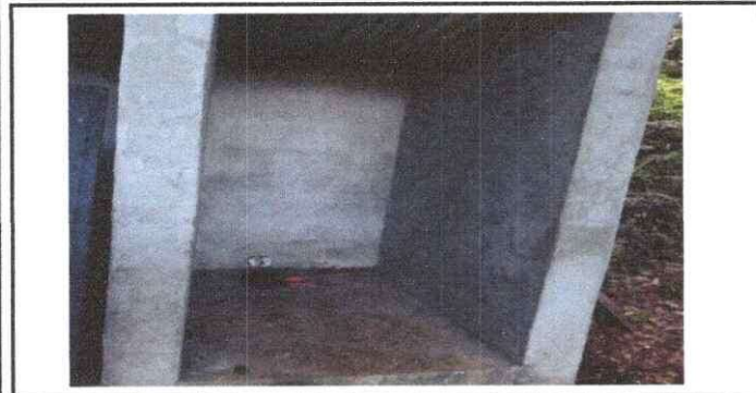
Foto 5: Se observa la falta de tazas sanitarias para tres letrinas y puertas en el modulo 1.